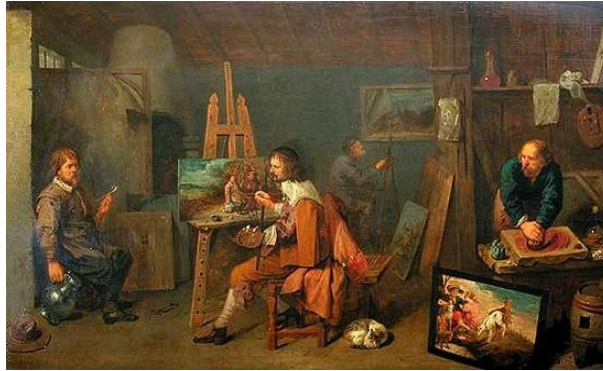
- “Interior de un atelier”, David Ryckaert (1638)-

En lo que refiere a su etimología, el término taller proviene de la palabra francesa “atelier”, que refiere al lugar donde trabaja un artista plástico o escultor, y que reúne a artistas conocedores de determinada técnica u obra fin de compartir lo que conocen al respecto, o bien a los discípulos de dicho artista a fin de aprender del maestro.