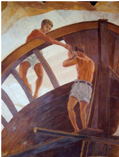
- “El astillero”, Mariano de Cossío (1950)-

A su vez, el término “atelier” proviene de “astelle” (“astilla”), en referencia a los astilleros, lugares donde se construyen o arreglan los barcos.